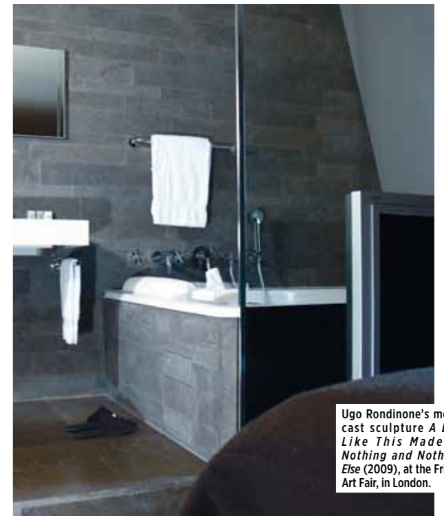
Ugo Rondinone's metal cast sculpture A Day Like This Made of Nothing and Nothing Else (2009), at the Frieze Art Fair, in London.

酒店创意总监 Kalaidjian 先生告诉我, 这里的每一把桌椅、每一个吊灯, 都是向设计师订制的, 比如 Murano 的灯光装置、Driade 设计制作的椅子, 而在房间内则能找到 Boffi 的水池和 Artelano 的床和沙发。可以说, Sezz 是这些大师设计作品的舞台。对于 Kalaidjian 来说, 奢华是由空间和服务所体现。空间设计采用高级订制, 服务自然也要私人且独一无二。Sezz Paris 不设礼宾部和前台, 却为客人配有私人助理, 让你获得一种切实的抵达之感。